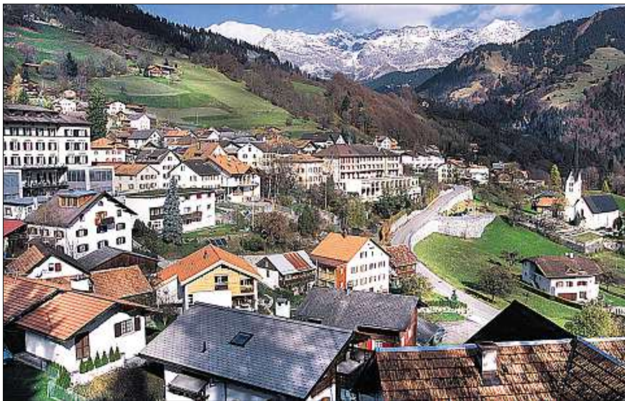
Il vitg da Seewis i.P. è situà sin ina terrassa a l'entrada dal Partenz.

Vischnanca politica, circuit Sievgia, district Partenz/Tavau (avant il 2001 Landquart Sut), situada sin ina terrassa sin la spunda dretga a l'entrada en il Partenz, cun la fracziun da Ferrera-Pardisla e la staziun da viafier Sievgia-Valzeina en